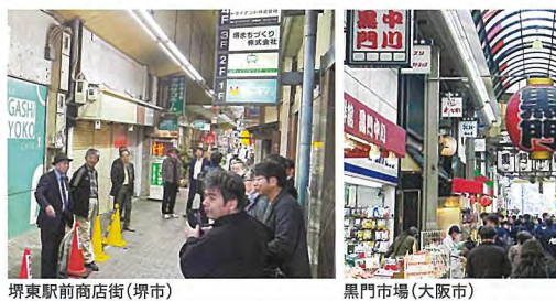
丸頓寺商店街(堺市) 黒門市場(大阪市)

視察は先に懸念を覚えた受講者も少なからずい。視察は先に懸念を覚えた受講者も少なからずい。