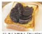
こしあん和軟あん「あいがけ」 こたわらが部屋に通じられる店内