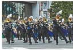
TOHO MARCHING BAND(昨年の様子)