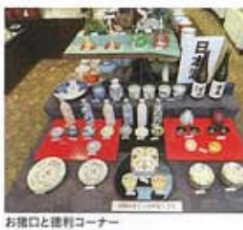
お漬口と徳利コーナー