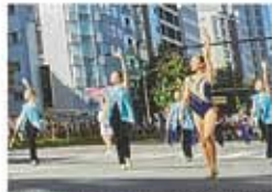
ナゴヤゴールドエンターテインメント(昨年の様子)

総勢300人以上による盛大なフラワーカーパレード。生花で飾られたフロート車とともに、パトロン、ブラスバンド隊、踊りチームなど、のべ15団体の精鋭たちが、華麗にパフォーマンスを繰り広げます。また、19日はタレントの岡崎紗絵さん、20日はお笑いコンビのキャイーンさんが、フラワーカーに乗ってパレードを盛り上げます。