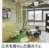
工夫を凝らした猫カフェ

「ねこのへや」にある猫カフェ「ねこのへやta助」。1Fでお好きなドリンクをオーダーして猫ちゃんとの時間をゆっくり楽しめたい。従業員でもある猫たちみんな保護猫。仲良くなった猫の譲渡ができます。実はこのカフェ、キャットウォークなどの猫専用家具の制作を行う会社が運営していて猫といきさつと生活できるマイホームやリノベーションについてもご相談いただけます。お子様連れやお友達とぜひ遊びに来てください。