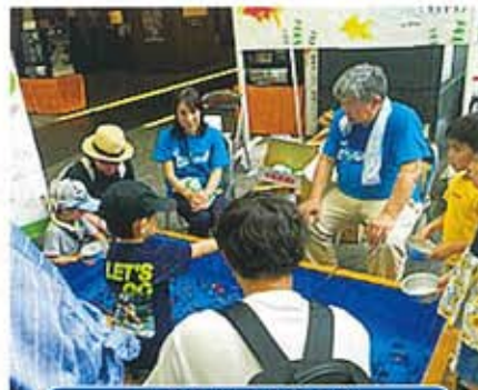
大須新天地通商店街