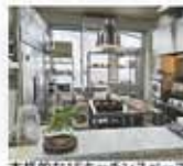
本格的な1Fキッチンスペース 五米を使った自然食弁当 キッチン付きの2Fレンタルルーム