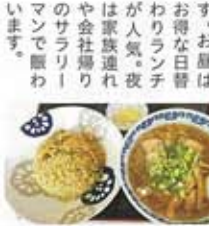
ランチ人気NO.1チャーラー